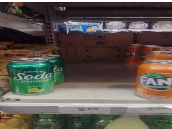
ANTES - PRATELEIRAS SEM PRODUTOS QUE ESTAVAM NO ESTOQUE