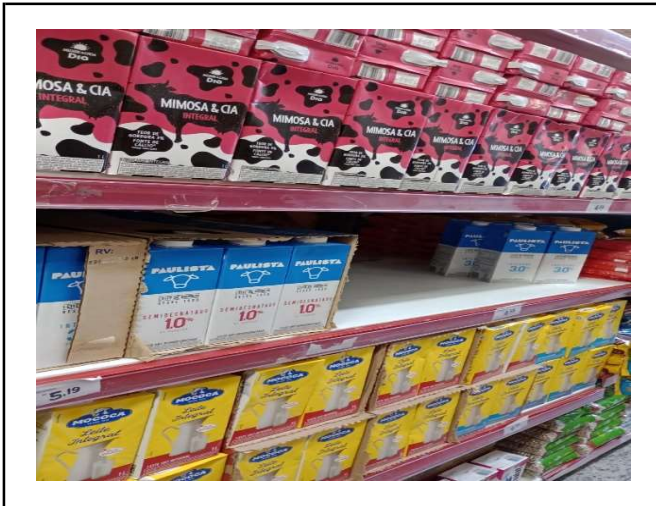
ANTES - PRATELEIRAS SEM PRODUTOS QUE ESTAVAM NO ESTOQUE