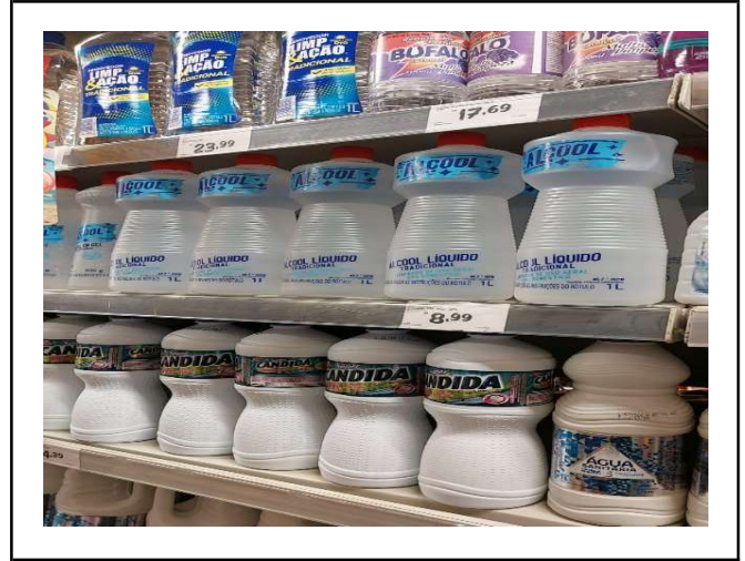
DEPOIS - PRATELEIRAS ORGANIZADAS COM PRODUTOS DO ESTOQUE