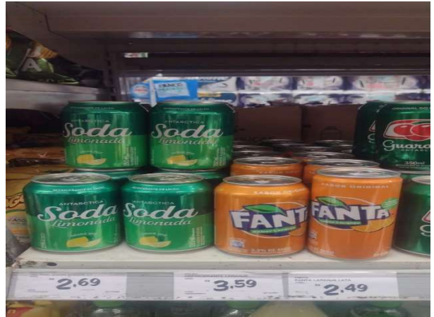
DEPOIS - PRATELEIRAS ORGANIZADAS COM PRODUTOS DO ESTOQUE