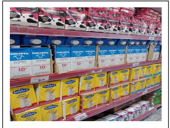
DEPOIS - PRATELEIRAS ORGANIZADAS COM PRODUTOS DO ESTOQUE