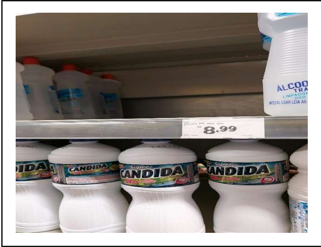
ANTES - PRATELEIRAS SEM PRODUTOS QUE ESTAVAM NO ESTOQUE