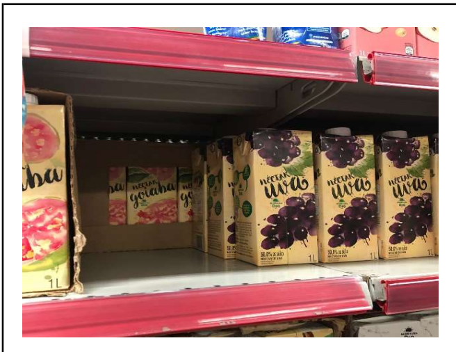
ANTES - PRATELEIRAS SEM PRODUTOS QUE ESTAVAM NO ESTOQUE