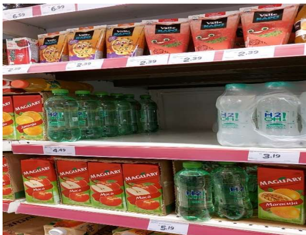
ANTES - PRATELEIRAS SEM PRODUTOS QUE ESTAVAM NO ESTOQUE