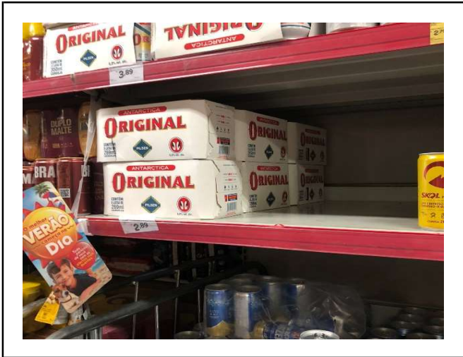
ANTES - PRATELEIRAS SEM PRODUTOS QUE ESTAVAM NO ESTOQUE