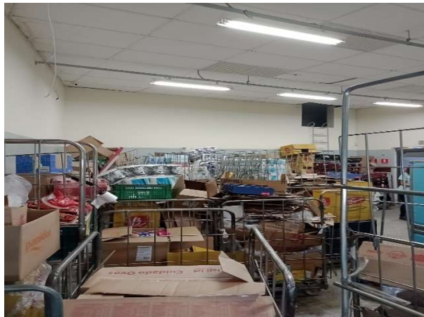
ANTES - ESTOQUE DESORGANIZADO COM PRODUTOS SEM VISIBILIDADE