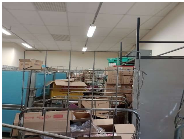
ANTES - ESTOQUE DESORGANIZADO COM PRODUTOS SEM VISIBILIDADE