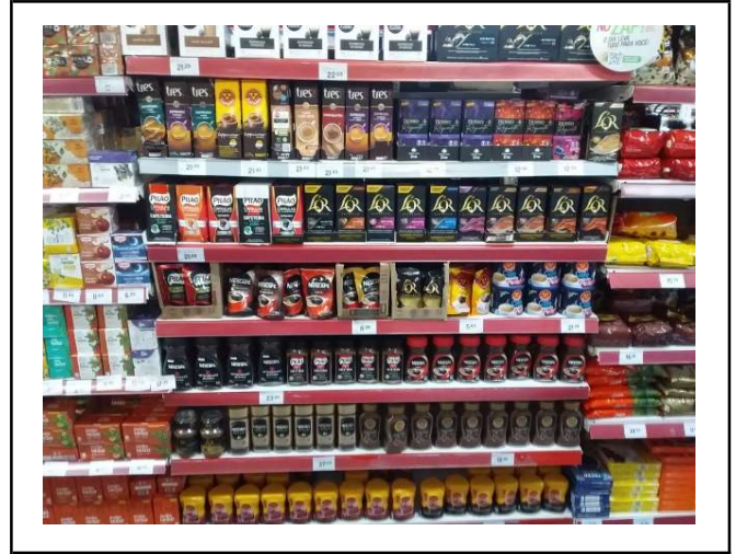
DEPOIS - PRATELEIRAS ORGANIZADAS COM PRODUTOS DO ESTOQUE