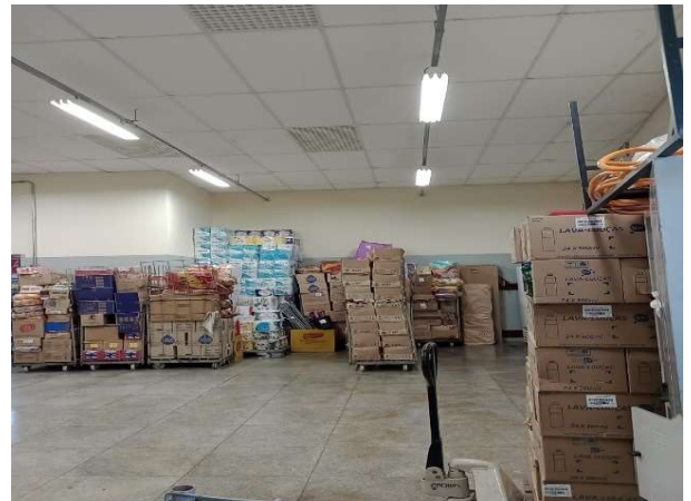
DEPOIS - ESTOQUE ORGANIZADO COM PRODUTOS E CAIXAS VISIVEIS