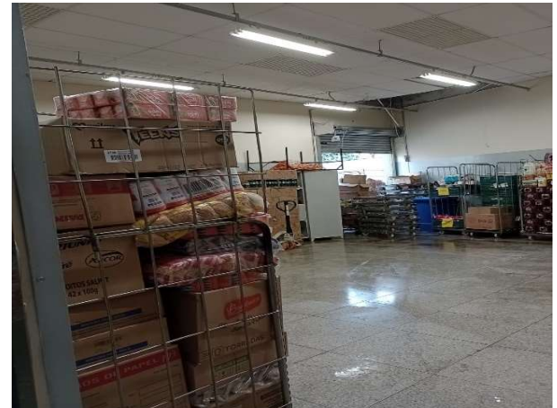
DEPOIS - ESTOQUE ORGANIZADO COM PRODUTOS E CAIXAS VISIVEIS