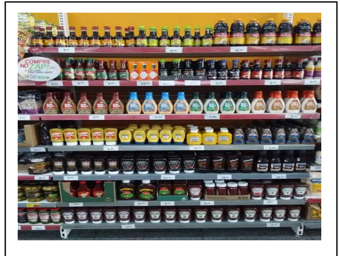
DEPOIS - PRATELEIRAS ORGANIZADAS COM PRODUTOS DO ESTOQUE