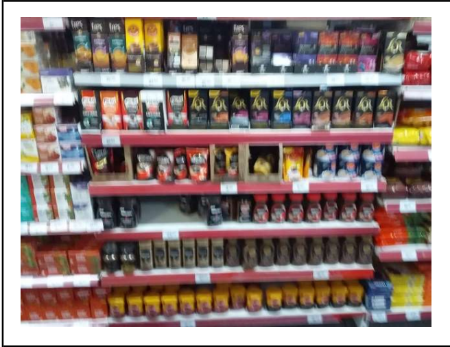
ANTES - PRATELEIRAS SEM PRODUTOS QUE ESTAVAM NO ESTOQUE