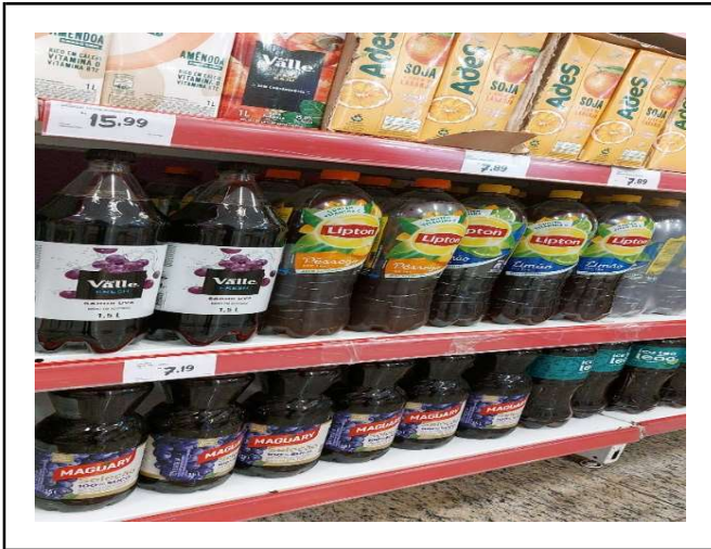
ANTES - PRATELEIRAS SEM PRODUTOS QUE ESTAVAM NO ESTOQUE