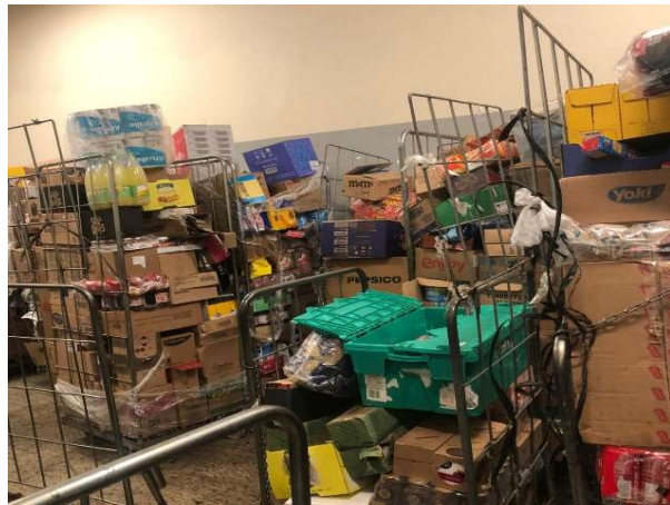
ANTES - ESTOQUE DESORGANIZADO COM PRODUTOS SEM VISIBILIDADE