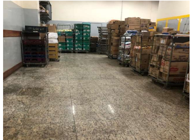
DEPOIS - ESTOQUE ORGANIZADO COM PRODUTOS VISIVEIS