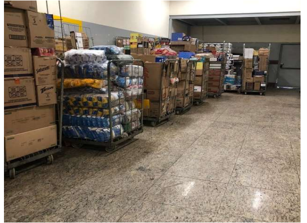
DEPOIS - ESTOQUE ORGANIZADO COM PRODUTOS VISIVEIS