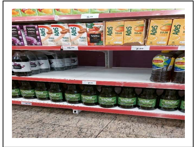
DEPOIS - PRATELEIRAS ORGANIZADAS COM PRODUTOS DO ESTOQUE