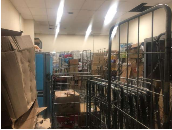
ANTES - ESTOQUE DESORGANIZADO COM PRODUTOS SEM VISIBILIDADE