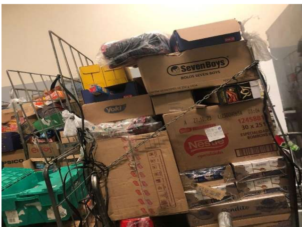
ANTES - ESTOQUE DESORGANIZADO COM PRODUTOS SEM VISIBILIDADE