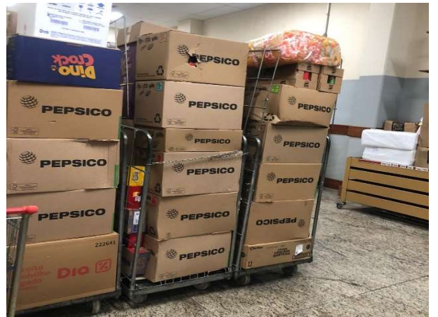
DEPOIS - ESTOQUE ORGANIZADO COM PRODUTOS VISIVEIS