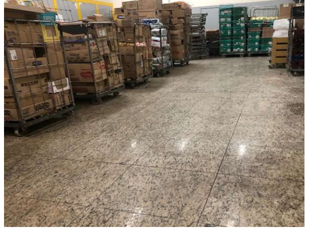
DEPOIS - ESTOQUE ORGANIZADO COM PRODUTOS VISIVEIS