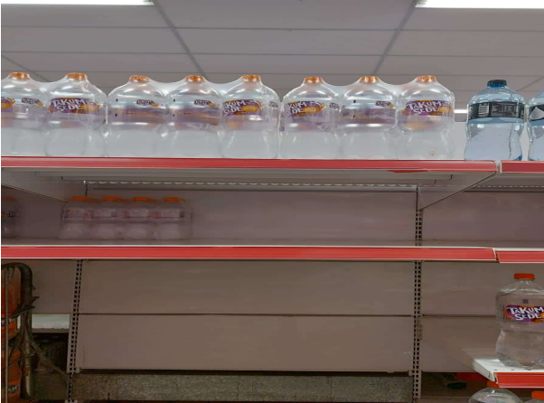
ANTES - PRATELEIRAS SEM PRODUTOS QUE ESTAVAM NO ESTOQUE