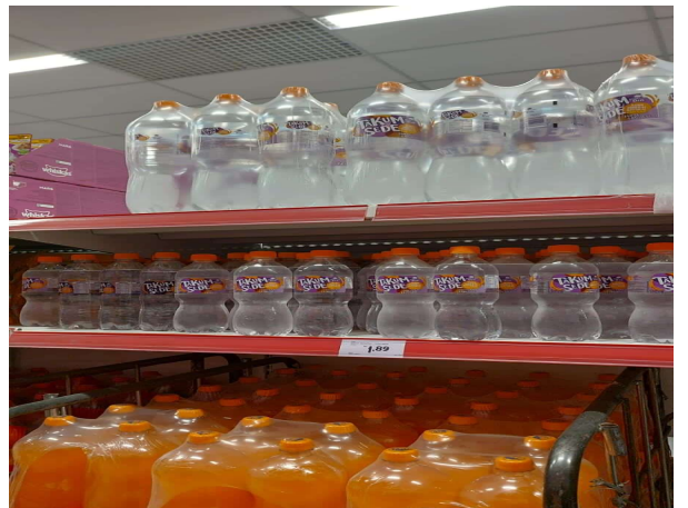
DEPOIS - PRATELEIRAS ORGANIZADAS COM PRODUTOS DO ESTOQUE