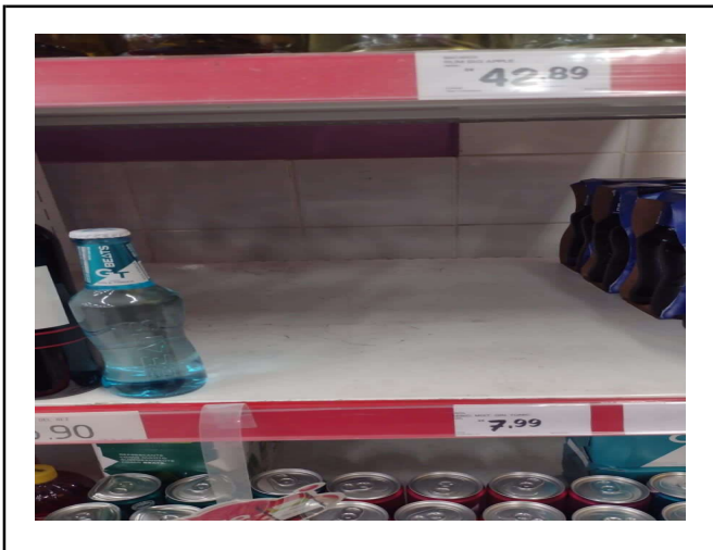
ANTES - PRATELEIRAS SEM PRODUTOS QUE ESTAVAM NO ESTOQUE