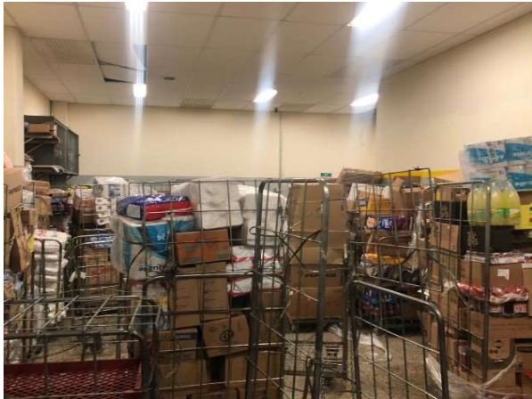
ANTES - ESTOQUE DESORGANIZADO COM PRODUTOS SEM VISIBILIDADE