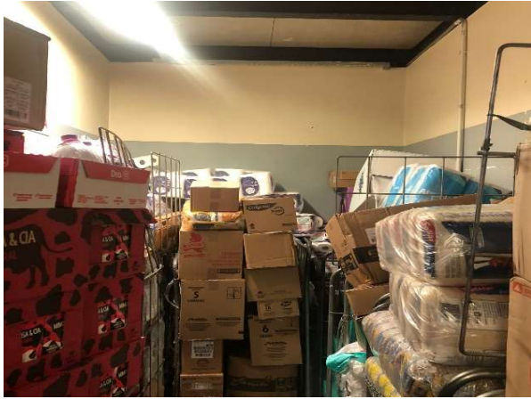
ANTES - ESTOQUE DESORGANIZADO COM PRODUTOS SEM VISIBILIDADE