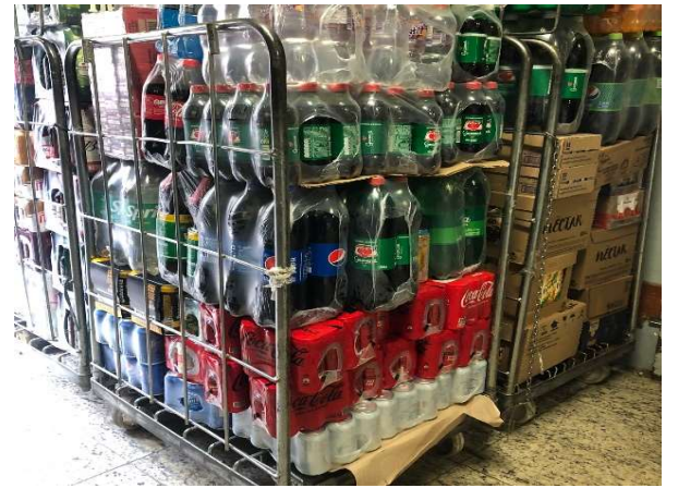
DEPOIS - ESTOQUE ORGANIZADO COM PRODUTOS VISIVEIS