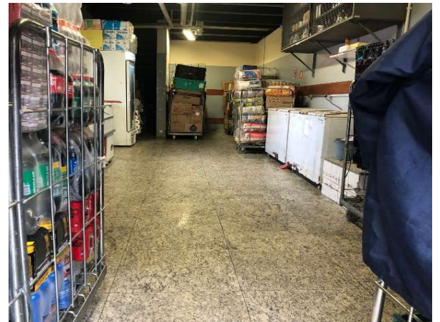
DEPOIS - ESTOQUE ORGANIZADO COM PRODUTOS VISIVEIS