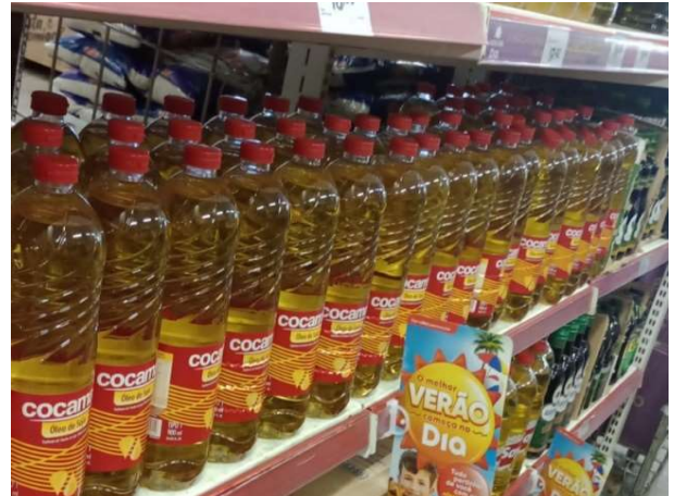
DEPOIS - PRATELEIRAS ORGANIZADAS COM PRODUTOS DO ESTOQUE