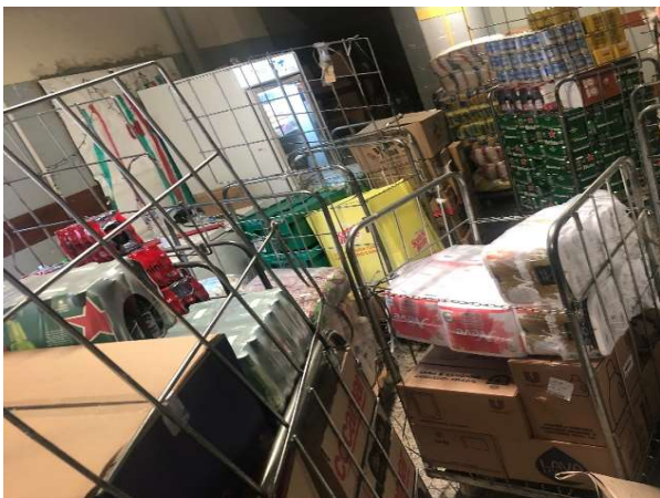
ANTES - ESTOQUE DESORGANIZADO COM PRODUTOS SEM VISIBILIDADE