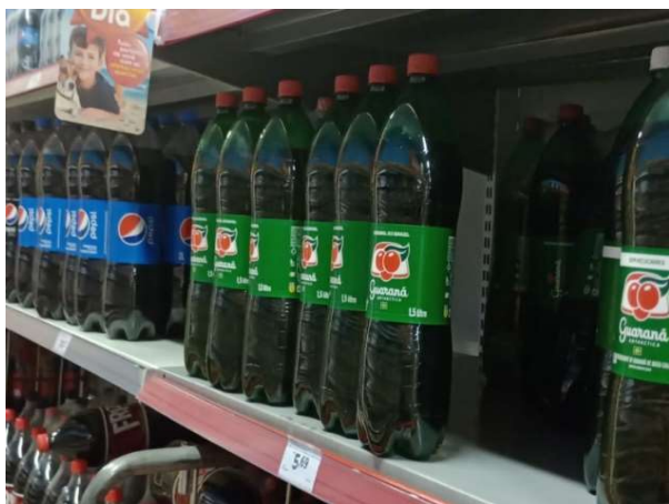
ANTES - PRATELEIRAS SEM PRODUTOS QUE ESTAVAM NO ESTOQUE