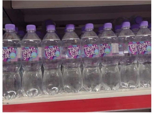
DEPOIS - PRATELEIRAS ORGANIZADAS COM PRODUTOS DO ESTOQUE