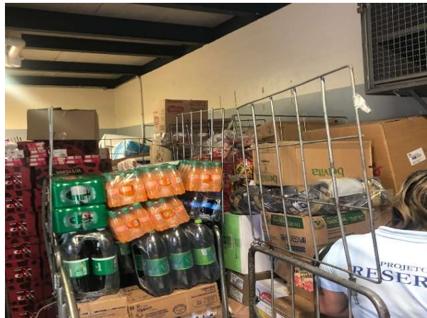
ANTES - ESTOQUE DESORGANIZADO COM PRODUTOS SEM VISIBILIDADE