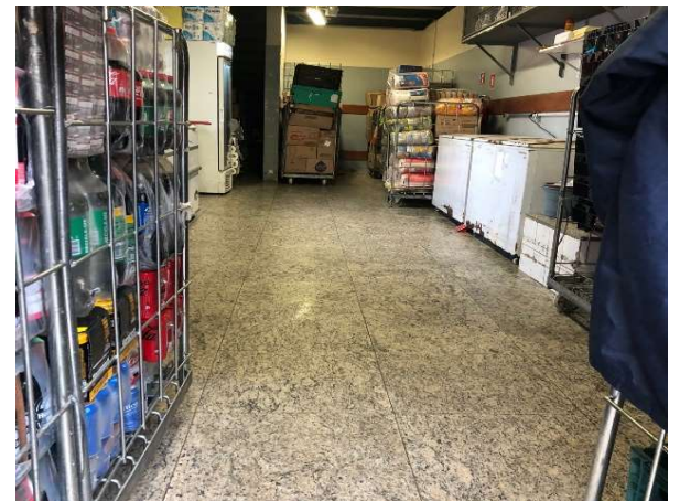
DEPOIS - ESTOQUE ORGANIZADO COM PRODUTOS VISIVEIS