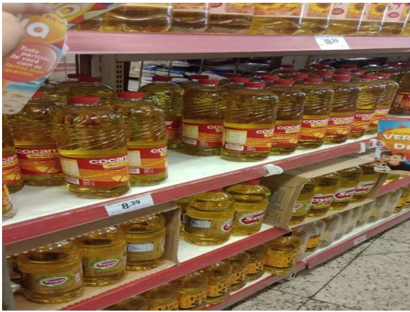
ANTES - PRATELEIRAS SEM PRODUTOS QUE ESTAVAM NO ESTOQUE