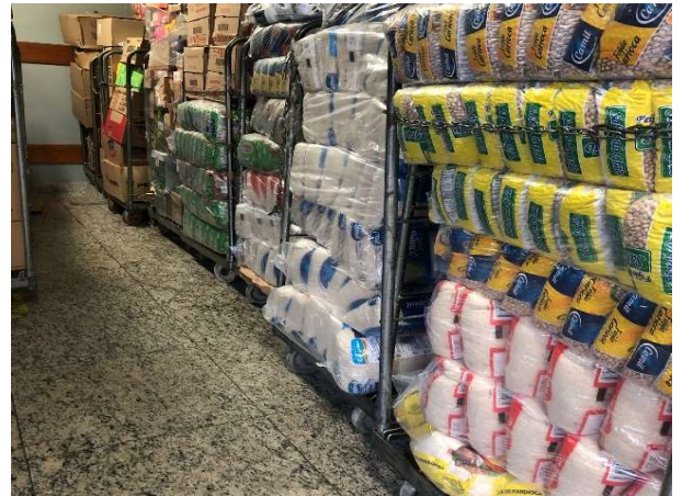
DEPOIS - ESTOQUE ORGANIZADO COM PRODUTOS VISIVEIS