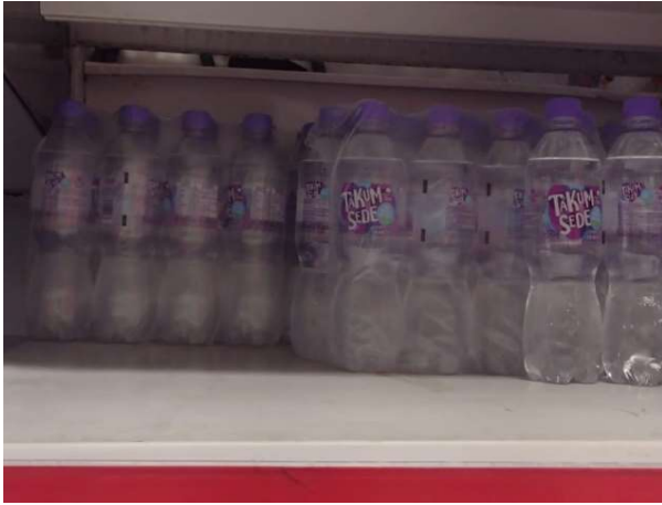
ANTES - PRATELEIRAS SEM PRODUTOS QUE ESTAVAM NO ESTOQUE