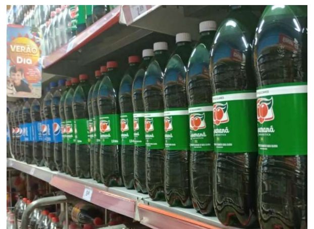
DEPOIS - PRATELEIRAS ORGANIZADAS COM PRODUTOS DO ESTOQUE