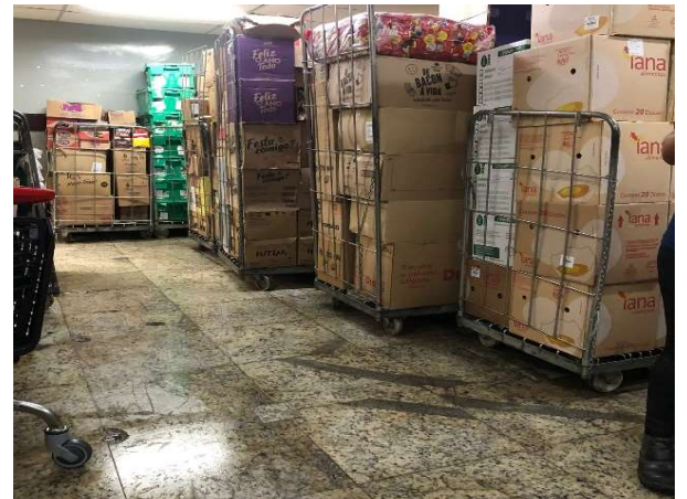
DEPOIS - ESTOQUE ORGANIZADO COM PRODUTOS VISIVEIS