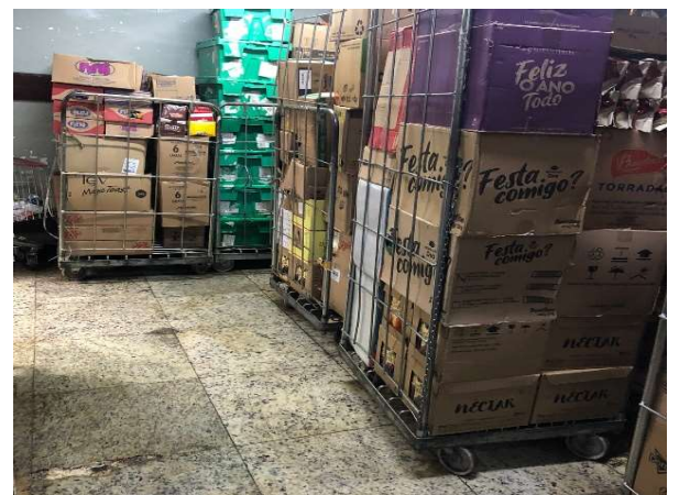
DEPOIS - ESTOQUE ORGANIZADO COM PRODUTOS VISIVEIS