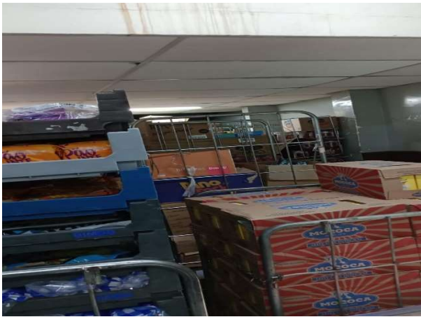
ANTES - ESTOQUE DESORGANIZADO COM PRODUTOS SEM VISIBILIDADE