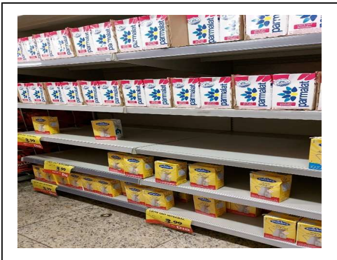
ANTES - PRATELEIRAS SEM PRODUTOS QUE ESTAVAM NO ESTOQUE