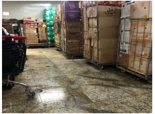
DEPOIS - ESTOQUE ORGANIZADO COM PRODUTOS VISIVEIS