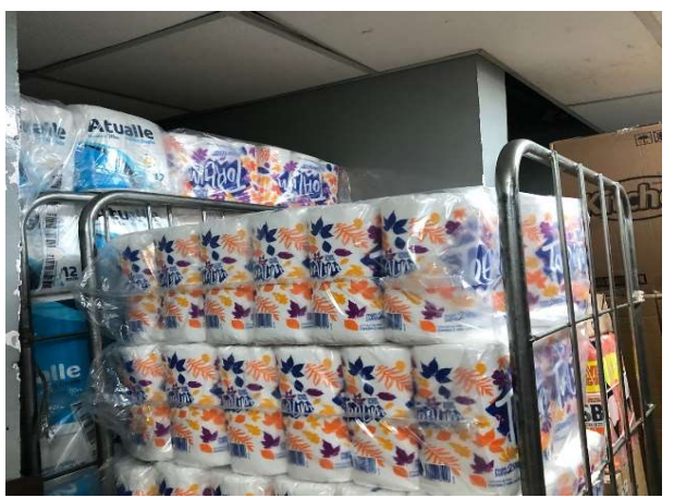
DEPOIS - ESTOQUE ORGANIZADO COM PRODUTOS VISIVEIS