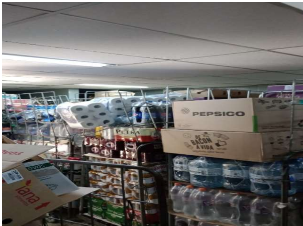
ANTES - ESTOQUE DESORGANIZADO COM PRODUTOS SEM VISIBILIDADE