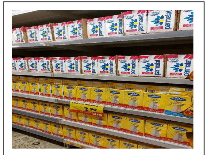
DEPOIS - PRATELEIRAS ORGANIZADAS COM PRODUTOS DO ESTOQUE