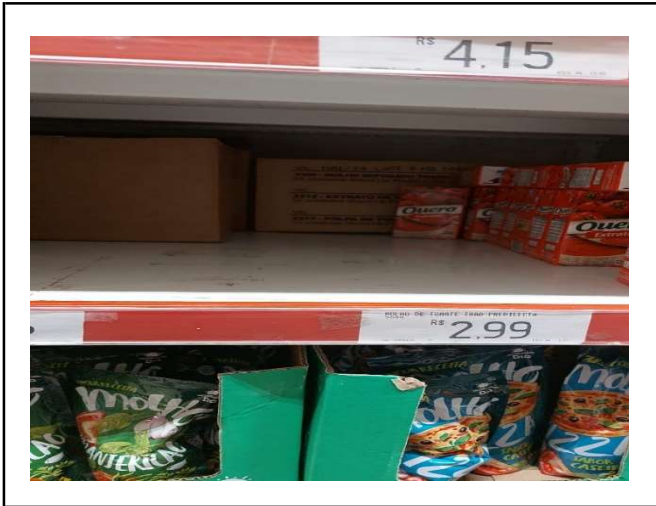
ANTES - PRATELEIRAS SEM PRODUTOS QUE ESTAVAM NO ESTOQUE