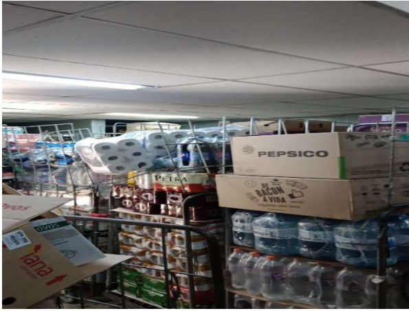
ANTES - ESTOQUE DESORGANIZADO COM PRODUTOS SEM VISIBILIDADE