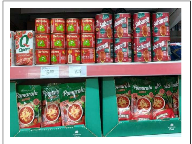
DEPOIS - PRATELEIRAS ORGANIZADAS COM PRODUTOS DO ESTOQUE