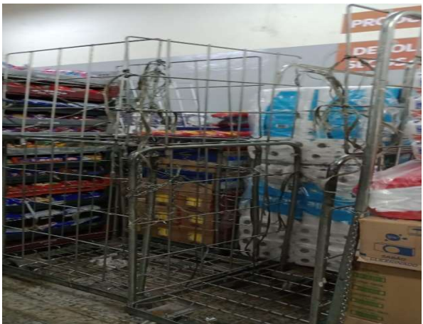
ANTES - ESTOQUE DESORGANIZADO COM PRODUTOS SEM VISIBILIDADE