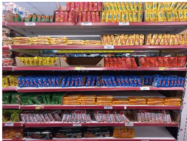
ANTES - PRATELEIRAS SEM PRODUTOS QUE ESTAVAM NO ESTOQUE