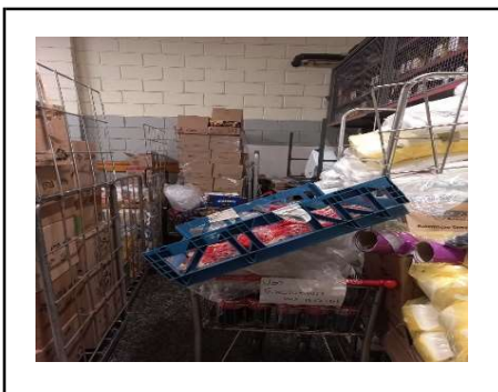
PRODUTOS VENCIDOS E AVARIADOS